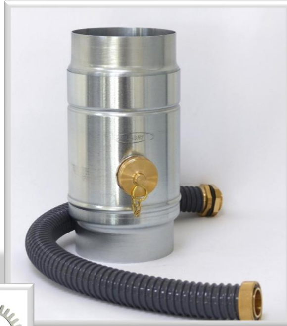
NEU – Laubfangsieb optional